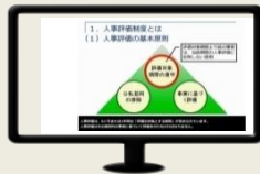
一次評価者の役割を 丁寧に解説