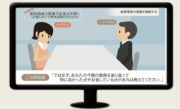
二次評価者・調整者 の関わり方を解説