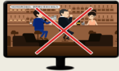
公務特有のリスク 事例を豊富に紹介