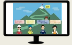
人事評価制度を 分かりやすく解説