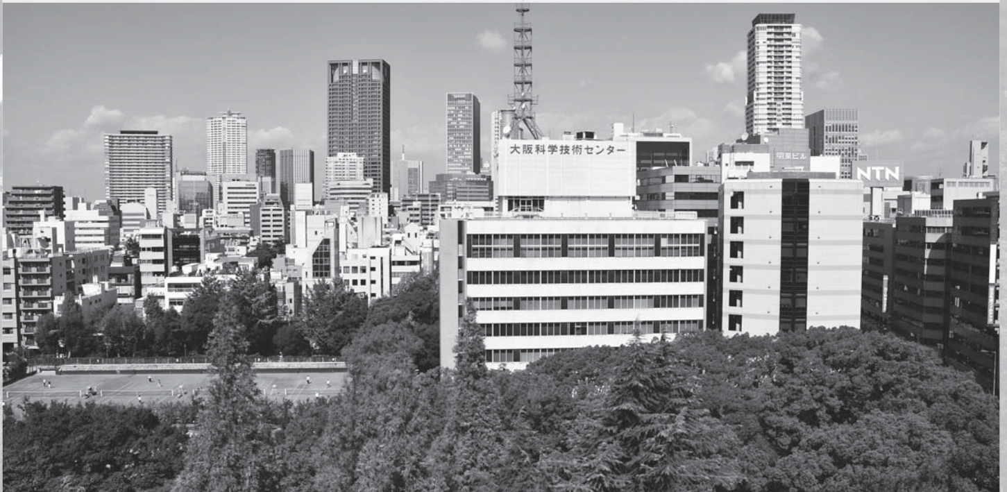
※ 写真は会場のある大阪科学技術センタービルです。